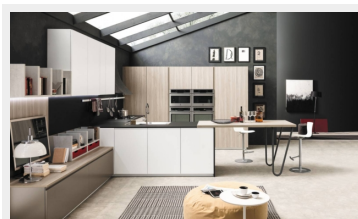
Cucina a U Volumia di Febal Casa

La classica cucina a U, detta anche a ferro di cavallo o a golfo, si sviluppa su tre lati consecutivi . A seconda delle caratteristiche della planimetria dell'ambiente, si avrà o meno la possibilità o meno di avere le due pareti parallele della stessa lunghezza con un risultato simmetrico oppure diverse con un effetto più mosso e articolato . La differenza tra le due opzioni è solo estetica , mentre a livello funzionale non cambia nulla. Anzi assecondare le caratteristiche strutturali