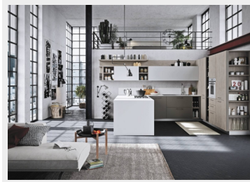
Cucina a U Fun di Snaidero

Lo sviluppo a ferro di cavallo dei mobili cucina garantisce la massima funzionalità, creando di per sé uno spazio ideale in cui collocare piano cottura, lavello e frigorifero ai vertici di un ideale triangolo di lavoro , con conseguenti percorsi fluidi e veloci tra queste funzioni principali della zona operativa della casa (cuocere, lavare, conservare). E perché l'operatività sia comoda e agevole, i percorsi non devono essere troppo lunghi : si può considerare generalizzando che la somma dei tre lati non debba superare in totale i 6 metri e mezzo , così da evitare movimenti inutili.