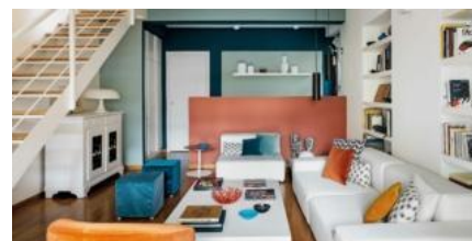
Mini loft ristrutturato con mansarda