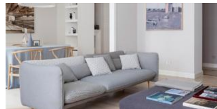
Una casa in stile nordico, elegante e accogliente