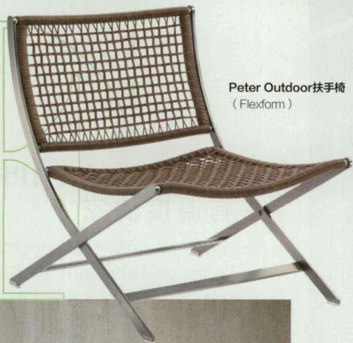
Peter Outdoor扶手椅 (Flexform)