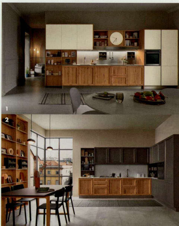
1&2. Milano系列厨房 (Veneta)

Veneta Cucine威乃达的新品Milano选择在米兰国际家具（上海）展览会首次发布，这套产品脱胎于品牌多年对消费者习惯和审美的研究结果。当极简风让人们感到厌倦，威乃达选择回归天然材质和古典手法来展现新的形式主义，并将他们定义为“摩登系列”。意大利威乃达橱柜大中华区CEO任端才向我们解释说：“极简风格流行至今，已经逐渐变成‘没有风格’了，因此我们希望用天然材质、古典手法来展现新的形式主义。”在意大利威乃达集团副总裁Dionisio Archiutti眼中，中国与意大利有着十分相似的家庭氛围，而厨房则往往成为家庭生活的中心，人们在这个空间里和家人欢聚、享受美食、传递情感，厨房就是爱意流动的中心，而威乃达则将致力于为所有人创造最舒适惬意的厨房空间氛围。