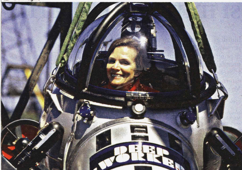
Sylvia Earle in un sommergibile al largo di Vancouver.

La signora degli abissi: "Salviamo il mondo dall'oceano di plastica" Guida alle 5R, domenica la grande campagna di Repubblica