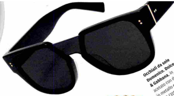
Occhiali da sole Domenico Dolce & Gabbana, in acetato con dettagli in metallo e lenti fumé (315 €).