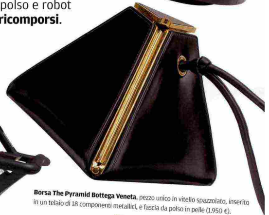
Borsa The Pyramid Bottega Veneta , pezzo unico in vitello spazzolato, inserito in un telaio di 18 componenti metallici, e fascia da polso in pelle (1.950 €).