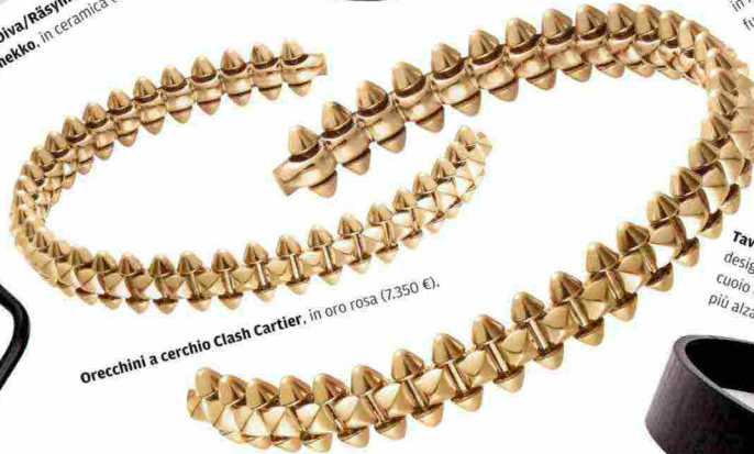
Orecchini a cerchio Clash Cartier , in oro rosa (7.350 €).