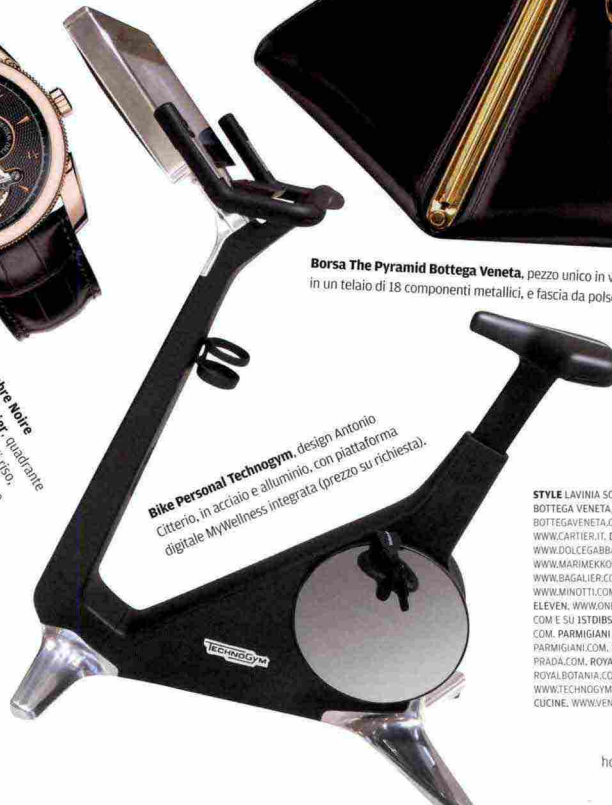
Bike Personal Technogym , design Antonio Citterio, in acciaio e alluminio, con piattaforma digitale MyWellness integrata (prezzo su richiesta).