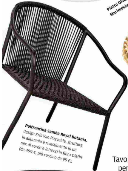
Poltroncina Samba Royal Botania , design Kris Van Puyvelde, struttura in alluminio e rivestimento in un mix di corde e intrecci in fibra Olefin (da 499 €, più cuscino da 95 €).