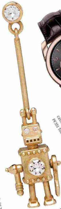
Orecchino Robot Prada Fine Jewellery, in oro e diamanti con certificazione RJC (3.800 € la coppia).