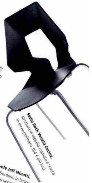
Sedia Rock Veneta Cucina , struttura in metallo composito e scocca in tecnopolimero (84 € più IVA).