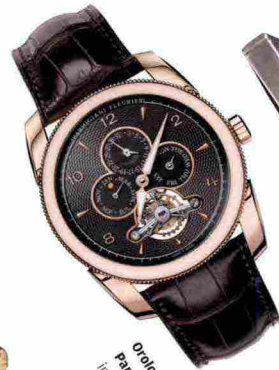
Orologio Ombre Noire Parmigiani Fleurier, quadrante in oro glicolico grama di 150, cassa in oro rosa e movimento PF351 Tourbillon (4.415,50 €).