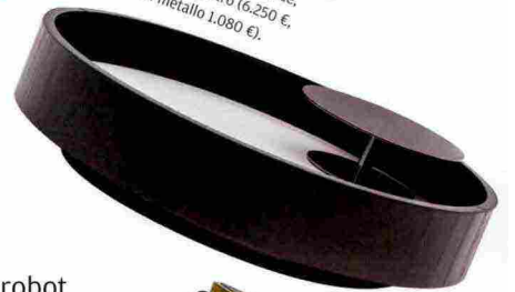
Tavolino girevole Jeff Minotti , design Rodolfo Dordoni, in larice, cuoio con piano in vetro (6.250 €, più alzata in metallo 1.080 €).