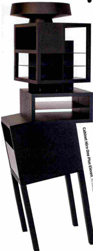
Cabinet Hitto One plus Eleven , in metallo e quercia (1.1710 € su listino).

Tavoli-matroske e cabinet cubisti. Piramidi da polso e robot pendenti. Gli accessori giocano a scomporsi e ricomporsi .