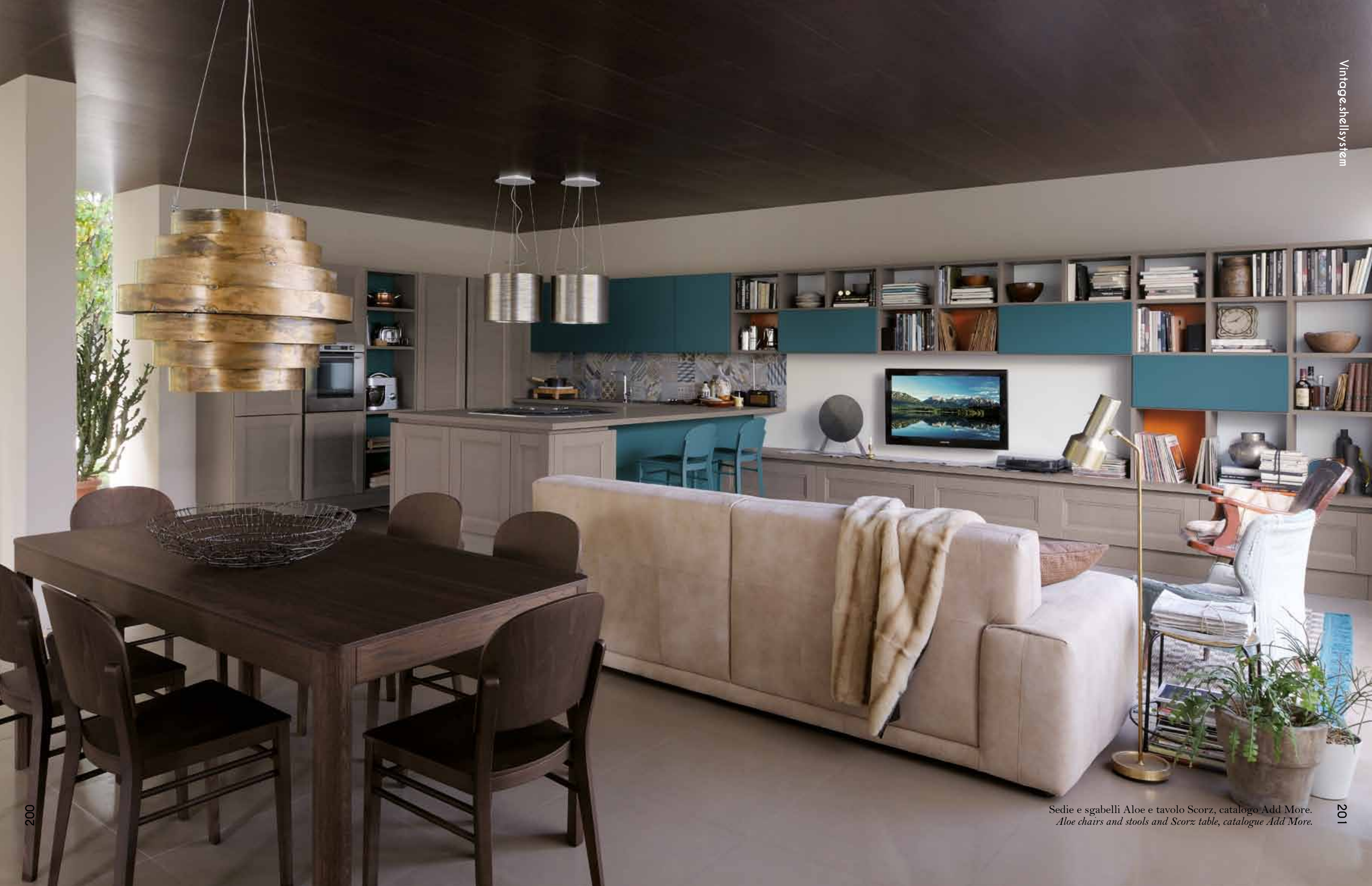
Sedie e sgabelli Aloe e tavolo Scorz, catalogo Add More. Aloe chairs and stools and Scorz table, catalogue Add More.