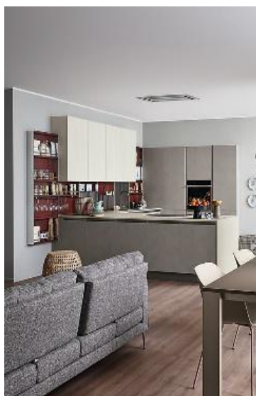
Si chiama Start Time Presa l'evoluzione «Quick Design» di Veneta Cucine (nelle foto a sinistra e qui sotto): un progetto di design a basso impatto economico che ben si adatta a una dimensione di vita reale e giovane