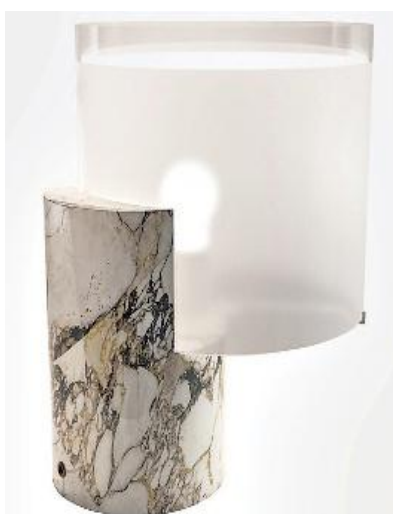
In alto, lo specchio della serie Bands di Tonelli design , disegnato da Angeletti Ruzza design ; al centro, luce e arte per la collezione Light Gallery di Pollice Illuminazione e, qui accanto, la lampada Lea di Matteo Nunziati per Tato : base in marmo e paralume in vetro