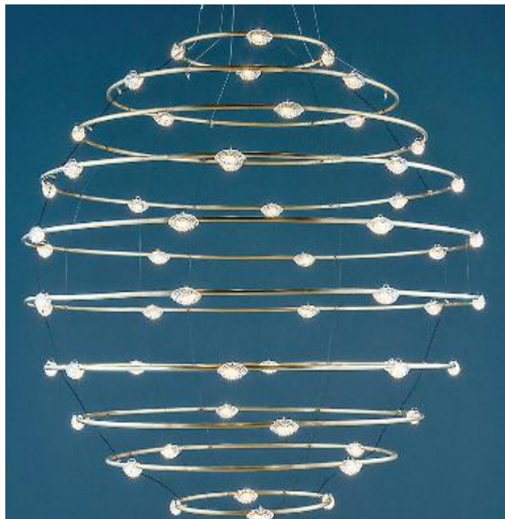
Qui sopra, il lampadario 56 Petits Bijoux di Catellani & Smith , rappresentazione di un effetto circolare dinamico, come quello prodotto da un sasso lanciato nell'acqua. Si compone di 56 lampadine al led che tempestano di luce i cerchi in ottone naturale. Sotto, due splendide coppe di vetro serie Unity disegnate da Marc Thorpe per Venini : tessitura artigianale di tipo senegalese e vetro battuto di pura tradizione muranese

Da segnalare infine gli specchi di Tonelli design ( Bands di Angeletti Ruzza design ) e le lampade Light Gallery di Pollice illuminazione disegnate da Florenzia Costa .