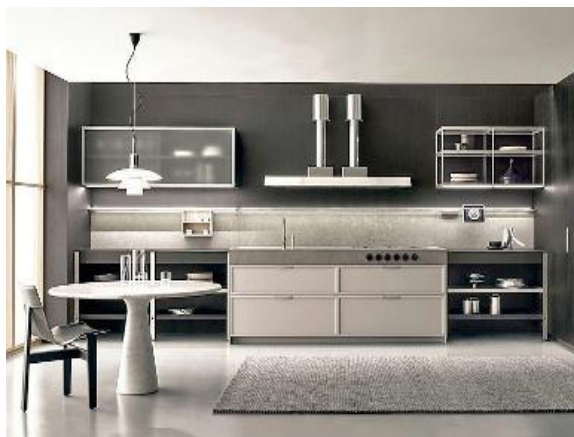
K-Lab è la cucina Ernestomeda di alto profilo che sarà presentata in occasione del FuoriSalone (qui sopra) nello showroom aziendale di Milano . Ideata da Giuseppe Bavuso , trae spunto dai grandi banchi di lavoro degli ambienti industriali e alterna volumi piani e vuoti. E' proposta anche nella nuova finitura Metalgrey